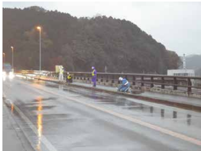
国道9号和田山大橋

今年も国道9号、312号、483号、宮津養父線などで散水融雪設備の点検整備業務を行っています。冬季の道路交通を守る為、確実に業務を遂行します。